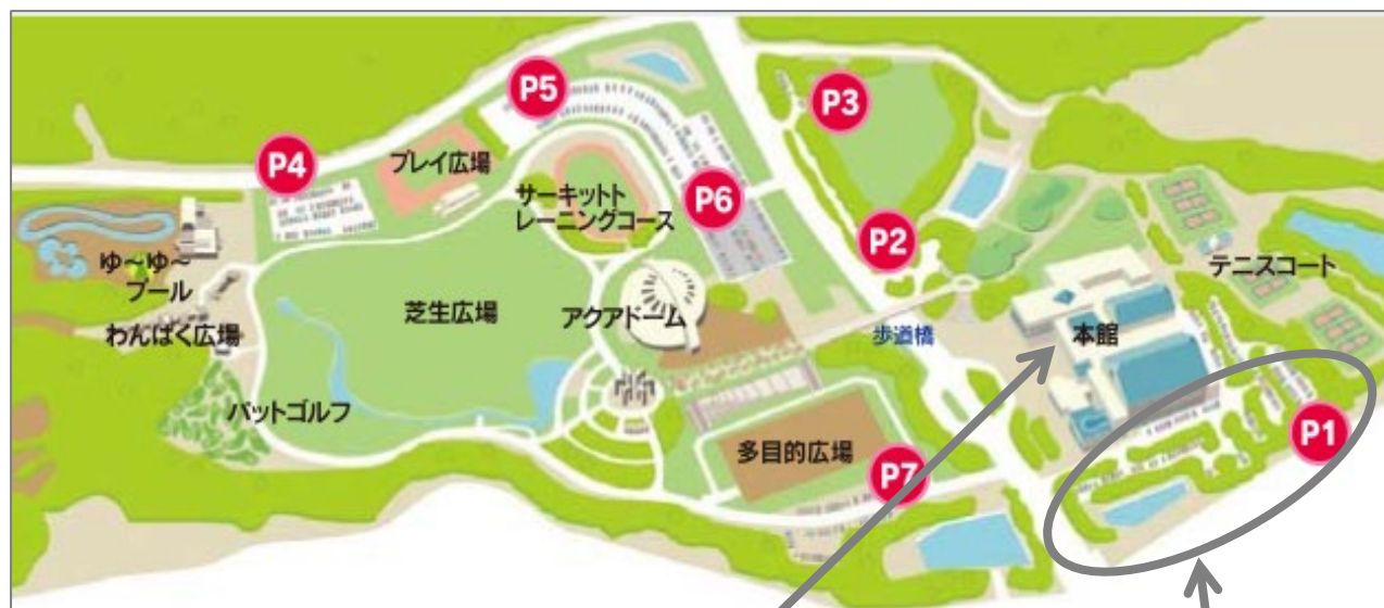
実技試験会場 (本館イベントホール)